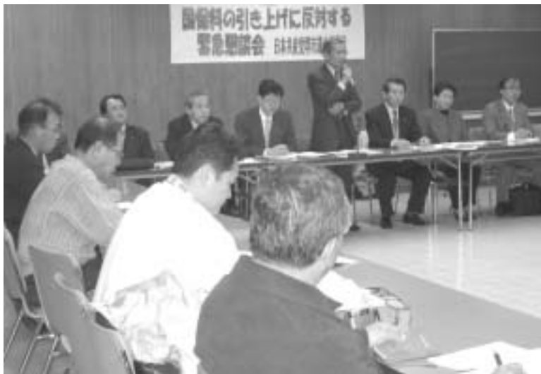
国保料値上げ問題で党議員団と市民の懇談会が開かれた

この保険料据え置き予算修正の提案に対して、堺市国保運営協議会や本会議で「一般会計からの繰り入れを大阪府下並みに増やすべき」と主張していた公明党を含め、与党は、質問も討論もせず否決し、国保料大幅値上げ案を賛成多数で可決してしまつたのです。