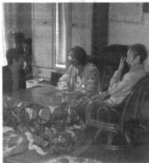
街かどデイハウスでつらくお年寄り

全国では、308の自治体が独自に保険料の減免制度を実施してきています。わが党が条例案を提出したことで、与党各党派も検討に乗り出し「全議員提案の決議を採択する方向でまとめた」との申し入れがあり、わが党がそれを受け入れて、決議案提出となりました。