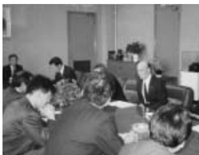
昨年12月幡谷市長に予算案についての申し入れをする党市議員団

庁舎建設、公共料金引き上げ、保育所民営化予算に反対 同和関係費のうち見直し不十分なものは認めず