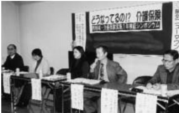
泉北ニュータウンで開催された介護保険シンポジウム

日本共産党は、介護保険の開始前から「安心して利用できる制度」にするために、低所得者に対する保険料と利用料の減免措置、軽減措置の実施や基盤整備の促進などを求めてきました。この一年を振り返って、日本共産党が提案してきたこれらのことが、いま現実が高齢者の間で強い要望となつてきています。