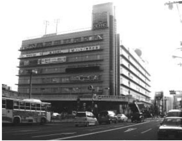
五月末で撤退するダイエー堺東店が入る「ジョルノ」

の保険料の通知が発送される三月にも、また、その問い合わせが殺到しそうです。 減免や軽減を実施の自治体続々 いま全国では政府の圧力をはねかえし、一四八の自治体が保険料の減免を実施し、四一〇の自治体が利用料金の軽減を実施（全日本民主医療機関連合会調査）しています。八十万人を擁する中核都市、堺市がいまだにこいつた措置を講じようとしていないこと自体、市民に冷たく、まったく情けない話です。 基礎整備、制度の改善は急務 また、特別養護老人ホームの待機者が約五百人とも言われているなかで、施設整備の推進も重要な課題です。「老後を安心して過ごす」ことができるよう、介護保険制度の改善と充実にむけて、日本共産党は、よりいっそう市民のみなさんとともに奮闘します。