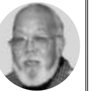
私が堺のみなさんと知り合ったのは、堺の臨海部の埋立地73区に自然をとり戻し、海釣りもできるなぎさ公園を」と取り組まれていた方たちとの出会いからです。

男女共同参画社会の実現が、二一世紀の最重要課題としながら、これまでの政府の計画から後退している所も少なくありません。本市も男女共同参画社会