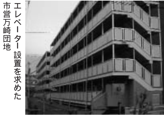
エレベーター設置を求めた 市営万崎団地

粘り強い運動で、このほど堺市は建設場所を変更することに決めました。 予定されていた場所は、工場に囲まれており、西側は阪神高速道路の高架線と国道二六号線が南北に走り車の往来が絶えないため、騒音と大気汚染がひどく、子どもが生活する施設的环境とはとても言えないことから保護者会が変更を強く求めてきました。 新しい建設場所は、現保育所から比較的近く、住宅地域にあり環境面でも問題がないと思われることから保護者会は仮設保育所については了解しました。しかし、新たな保育所は民営化せず、公立保育所として存続するよう引き続き堺市に要求しています。 日本共産党市議員団は堺市に対し、公立保育所の民営化方針の撤回と、すべての待機児の一日も早い解消を保護者、市民の皆さんとともに求めていきます。