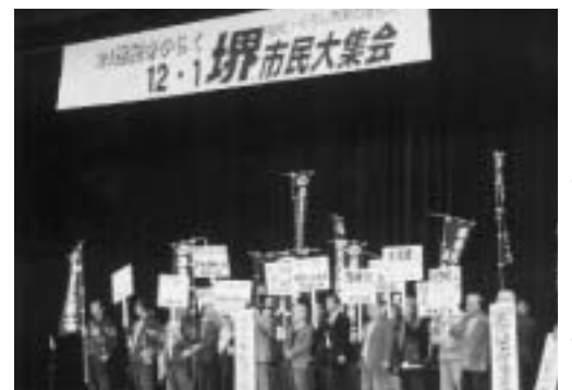
市民大集会(十二月一日)

このような 市政をこれか らもつづける ことは堺市の 将来に重大な 悔いを残すこ とになります。