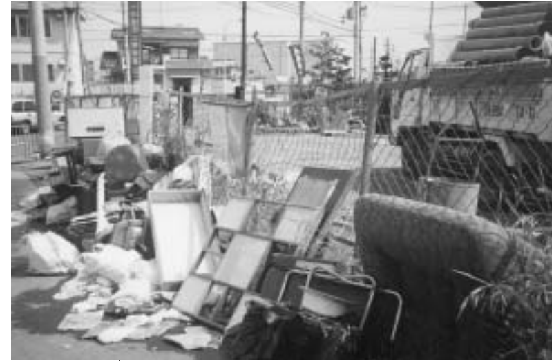
粗大ゴミの不法投棄が市内あちこちに。有料化で増えないか心配されている。

4月からテレビ等家電四品目を廃棄し販売店に引き取ってもらう場合、冷蔵庫で4600円のリサイクル費用に引き取り料金を加えたお金が必要になります。