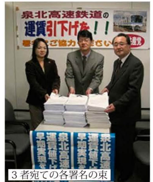
3者宛ての各署名の束

の切実な願いであり来年度 予算に反映するよう要請し ました。特に、①上下水道 料金引き下げ、②国保料金 引き下げ③お出かけ応援バ スの毎日運行、④小中学校 の教室にエアコン設置と中 学校給食の実施、を強く求 めました。