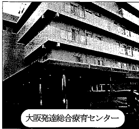
大阪発達総合療育センター

一月十五日（火）市議会健康福祉委員会が、大阪市東住吉区にある重症心身障害児・者施設（大阪発達総合療育センター）を視察してお話を聞いてきました。これは、堺市が計画している健康福祉プラザ建設が予定より随分遅れている中で、「同じくなら」「よりよいもの」を「行ったもの」です。