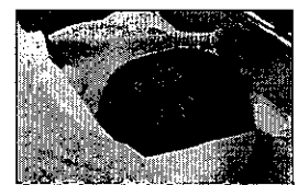
初孫の誕生に想う

一月十七日、元気な産声を上げた新しい命が社会の仲間入りをしました。よろしく！初孫の誕生です。病院に駆けつけた数分後に、「生まれた！」との声が聞こえました。時計の針は午前二時二十五分を指していました。阪神淡路大震災から丁度十三年目の日です。私は、おじいちゃんになりました。両親の愛情をいっぱい受け、のびのびとすこやかに育って欲しいと思います。今、少子化や核家族化、地域との繋がりが希薄化し、子ども同士の遊ぶ機会が少なく、親は子育てに不安があっても相談できない現状が広がっています。親と子を支援し「どの子もすこやかに育つ権利」を保障するのが政治と社会の責任です。何よりも命を大切に・命を最も粗末にするのは戦争です。子どもたちに平和な社会を引き継ぐために憲法九条（戦争の放棄）を守らなければと、思いを強くしました。