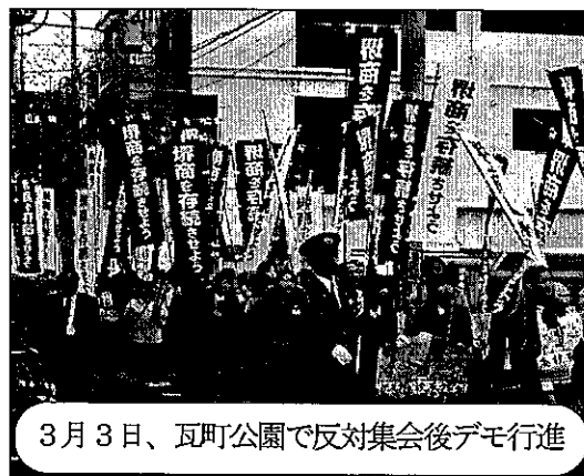
3月3日、瓦町公園で反対集会後デモ行進

ちによってつくられ、支えられてきた歴史があります。鳳幼稚園の場合、地域の婦人会の人たちが土地の提供や資金集めに奔走して昭和四年四月七日に私立幼稚園として設立しました。昭和十六年四月一日に鳳町立幼稚園になり、昭和十七年七月一日に堺市との合併で堺市立鳳幼稚園となりました。昭和二十年七月九日夜半の空襲で被災しましたが、昭和二十一年五月には鳳小学校の一室で再開、昭和二十九年十二月十七日に現在の地に移転しました。市立幼稚園は歴史と伝統に培われ今日の幼児教育を築いてきたのです。こうした経過を無視し、公的責任を放棄する市立幼稚園の廃止は認められません。